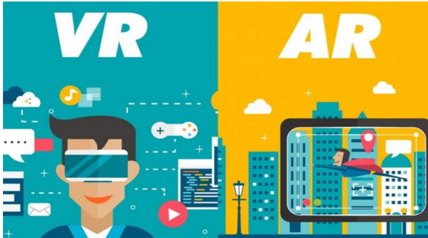
Şekil 1. Artırılmış gerçeklik ile sanal gerçekliğin karşılaştırılması (URL 1).

Bu bağlamda son yıllarda eğitim ortamlarında popüler olan ve etkisi merak edilen, öğrencilerin ilgisini çekecek ve motivasyonlarını artıracak düşünülen teknolojilerden birisi olan artırılmış gerçeklik (AG) ve sanal gerçeklik (SG) olmuştur. Gerçeklik ile sanal verilerin aynı anda bir araya getirildiği teknolojiye artırılmış gerçeklik olarak tanımlanır (Azuma, 1997; Milgram ve Kishino, 1994). Sanal gerçeklik ise üç boyutlu modellerle evren ortamının canlandırılarak dijitale çevrilmesidir. Yani sanal gerçeklikte önümüzdeki durum sanal bir ortama taşınırken, artırılmış gerçeklikte durum daha farklıdır. Artırılmış gerçeklik, içinde bulunduğumuz durum üzerine sanal verilerin yerleştirilmesidir (Billinghurst, 2002; Billinghurst vd., 2001; Kerawalla vd., 2006).