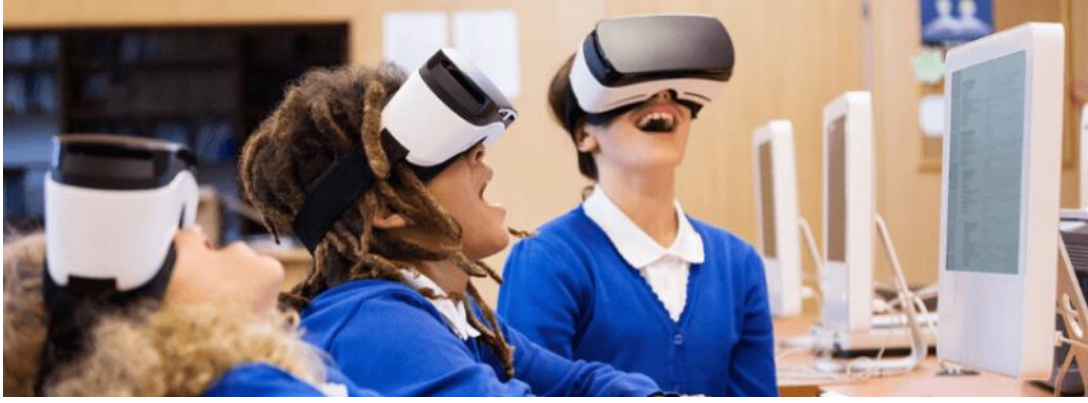
Şekil 2. Sanal gerçeklik örneği (URL 2).

AG ise gerçek öğelerden yararlanılmaktadır. Önemli olan ihtiyaca uygun tasarımların yapılarak canlandırılmasıdır. Gerçek hayattaki nesnelere çalışabilmesi nedeniyle sağlıktan eğitime, mimariden uzay araştırmalarına kadar birçok disiplin ile kolayca entegre olabilmektedir. Beyin fonksiyonlarının düzelmesi, eğitim, eğlence, hikaye anlatımı, oyun, sanal sınıflar, simülasyonlar gibi çeşitli kullanım alanları bunlara örnektir (Bozat ve Dedelioğlu, 2018).