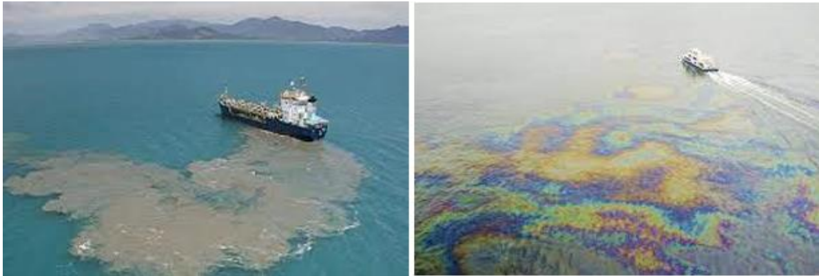
Şekil 1. Denizlerde sintine suyu boşaltımı ve petrol kirliliği (URL 3, 2018; URL 4, 2023).

Gemilerin büyük çoğu uluslararası hukuk ve uluslararası deniz hukuku gereği sintine atıklarına veya herhangi bir atıklarını denize boşaltmaları kesinlikle yasaklanmıştır. Ancak yapılan araştırmalara göre dünya ticaretindeki önemli role sahip bu devasa yük gemilerinin %20 si kadarı atıklarını denize boşaltmaktadırlar (Öztürk vd., 2021) (Şekil 1).