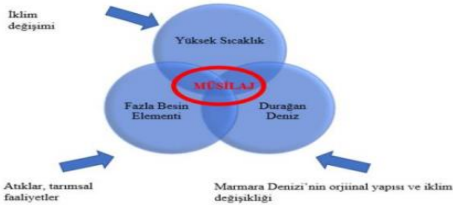
Şekil 3. Marmara Denizi'nde müsilaj oluşumuna sebep olan etmenler (Koncağül vd., 2022).

Marmara Denizi'nin kıyılarında artan yerleşim yerleri nedeniyle nüfus artışı yüksek düzeydedir. Nüfus artışı ve yoğun sanayileşme nedeniyle evsel ve sanayi atıkları hızlı bir artış göstermektedir. Marmara denizi çevresindeki sanayi tesislerinin ön arıtma yapmadan veya kaçak olarak atıksularını kanalizasyon sistemine vermesinin ve atıksuların sucul ortama direkt verilmesinin önlenmesi gerekmektedir (Yümün ve Kam, 2021).